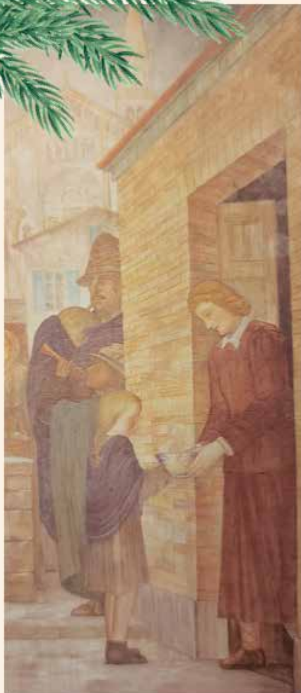
Particolare tratto dagli affreschi di Vanni Rossi nella chiesa di Porto d'Adda

L'Amministrazione Comunale e la Redazione de la "Voce" augurano a tutti i Cittadini "Buone Feste"